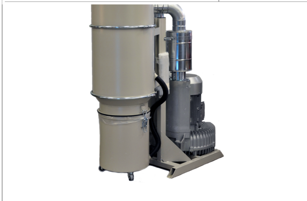
CE-13 - Centrale d'aspiration