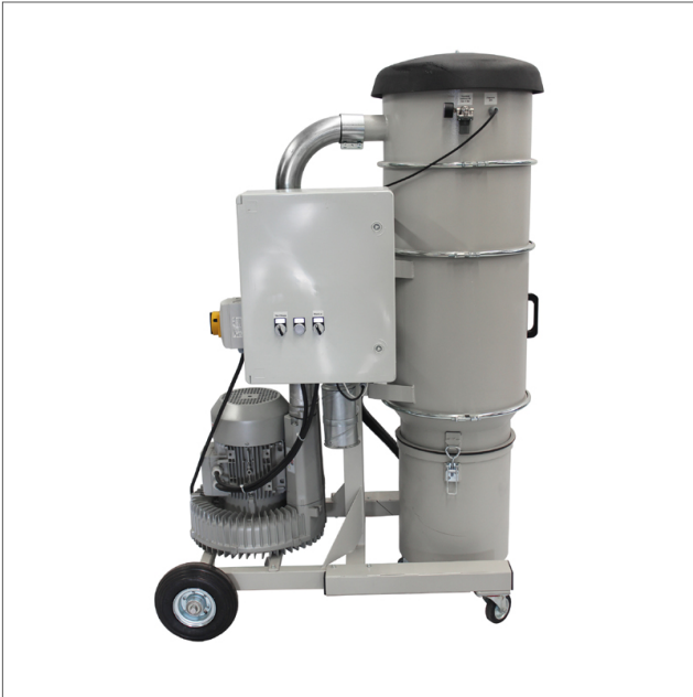
CE-MOB - Mobile suction unit