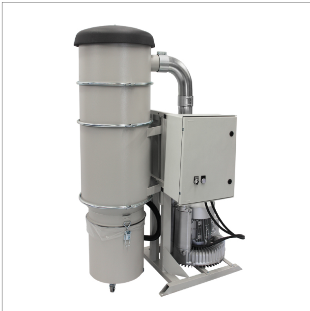
CE-3/CE-5 - Suction unit