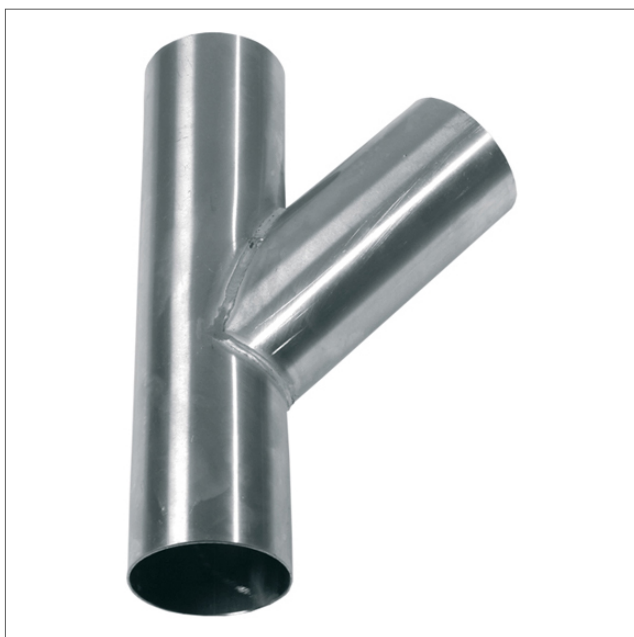
STBP - Branch pipe 45° galvanized

Dérivation 45°, électro-zingué. Epaisseur 1,5 - 2 mm.