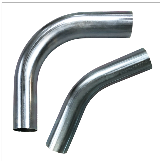
STBE - Steel bend galvanized

Coudes en acier galvanisé, avec bords droits pour raccordement par manchons