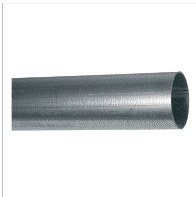
STPI - Steel pipe sendzimir galvanized

Les tubes STPI sont fabriqués en acier soudé galvanisé par procédé sendzimir. Ils sont disponibles en longueurs de 3000 mm (+/-2 mm) et de 6000 mm (+/-5 mm)